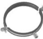
COLLARE CON GUARNIZIONE

Collare per sostegno canali in lamiera zincata a 2 pz. con dado M8/M10.